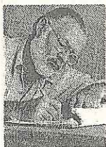
Un'immagine dello scrittore Ernest Hemingway