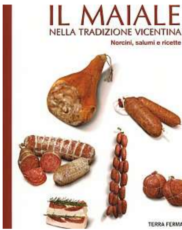
La copertina del libro edito da Terra Ferma

E poi le sagre di paese e i piatti celebri, come gli "ossi de mas'cio"