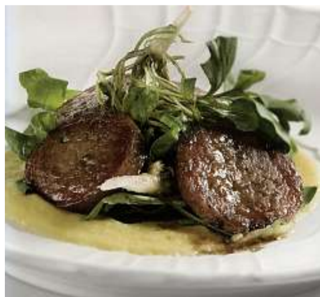
Il salame all'aceto balsamico

dopo risorge in squisiti salumi e ricchi piatti. Al maiale, il Consorzio di promozione turistica "Vicenza è" e la Provincia di Vicenza hanno dedicato un libro di 140 pagine, edito da Terra Ferma. Il volume prende in esame la tradizione vicentina